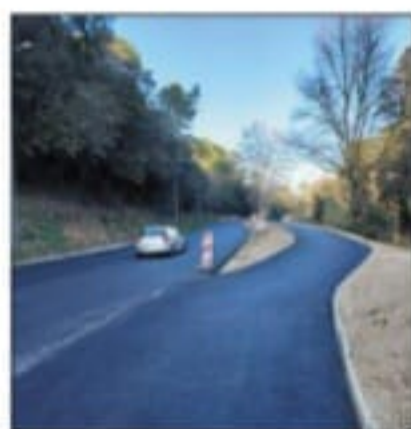
La nouvelle bande cyclable aménagée.

Entamés il y a maintenant un peu plus de trois mois, les travaux de voirie sur le chemin du Carimaï sont sur le point de se terminer. Il s'agissait, dans un premier temps, de reprendre totalement la chaussée de cette ancienne route départementale extrêmement fréquentée entre le rond-point Laborde/Garibondy et le pont de l'autoroute A8 vers l'Aubarède, mais aussi de l'élargir très sensiblement en vue de créer deux bandes cyclables.